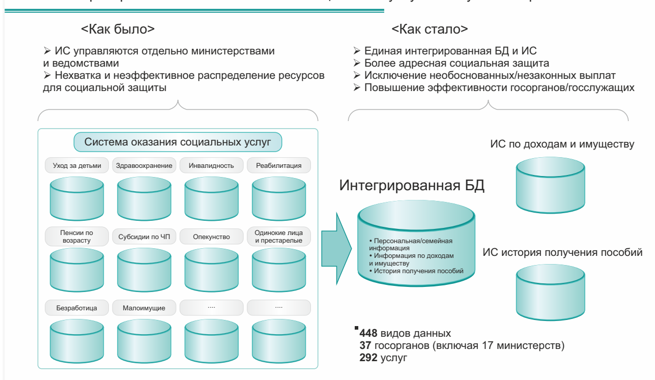
Рис №1. Преобразование системы оказания социальных услуг в Республике Корея

Администрация Пак Кын Хе, избранной на пост президента в 2013 году, позже во время избирательной кампании заявила, что «социальная система должна подходить для пользователей любого возраста». Таким образом, разработка Информационной системы социальной безопасности стала еще более важной задачей на пути к выполнению обещания.